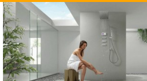
Hi-tech w łazience. Digitalizacja jednym z wiodących trendów