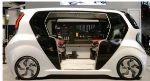
LG ThinQ Zone na targach CES 2020