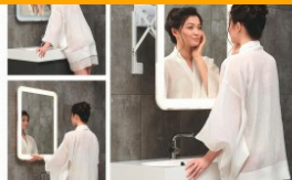
Wielofunkcyjna AI pomoże w wyszukiwaniu produktów na Amazonie