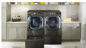
CES 2020: innowacyjna pralkę wyposażoną w sztuczną inteligencję