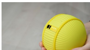
CES 2020: robot - kulka zadba o Twoją formę