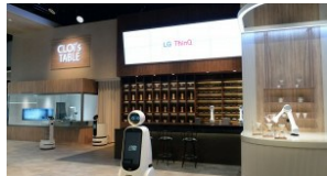
CES 2020: rozwoju sztucznej inteligencji i zaawansowane poziomy doświadczeń AI