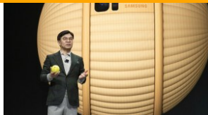
CES 2020: Samsung zapowiada „Erę Doświadczeń”