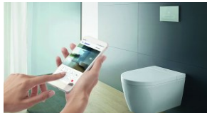
Twitter chce ograniczyć możliwość komentowania wpisów